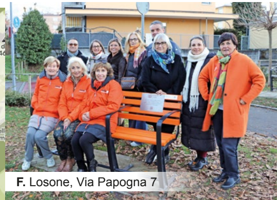
F. Losone, Via Papogna 7

Seguite il percorso delle panchine su Google Maps