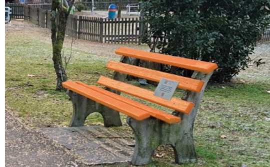
E. Ascona, Via Mt. Verità, parco giochi Parsifal

sensibilizzazione contro la violenza. Un modo nuovo per dimostrare attenzione al mondo delle donne camminando tra una panchina e l'altra, ammirando gli splendidi paesaggi circostanti e riflettendo su tutto quello che ognuno di noi può ancora fare per un futuro libero da violenze e ingiustizie sociali.