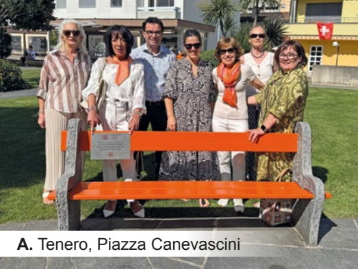
A. Tenero, Piazza Canevascini

Il tempo è vita. In occasione della Giornata Internazionale della Donna, l'8 marzo, lo Zonta Club Locarno propone di dedicare un po' di tempo alla riflessione, compiendo un percorso che si snoda attraverso sette Comuni del locarnese e che collega altrettante panchine di color arancione dedicate alla