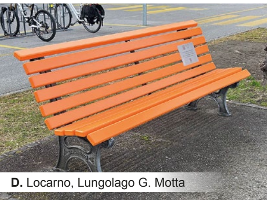
D. Locarno, Lungolago G. Motta