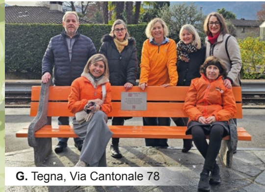
G. Tegna, Via Cantonale 78