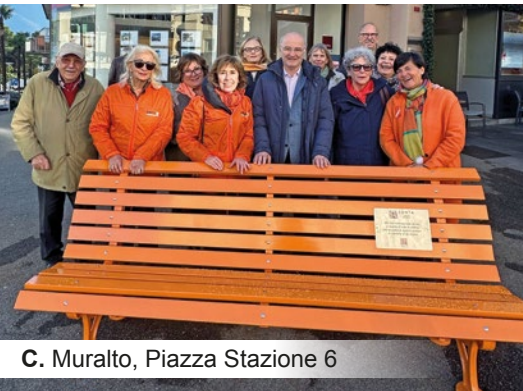
C. Muralto, Piazza Stazione 6