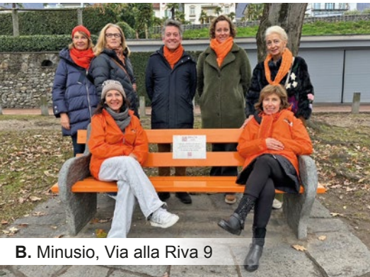
B. Minusio, Via alla Riva 9