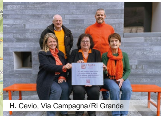
H. Cevio, Via Campagna/Ri Grande